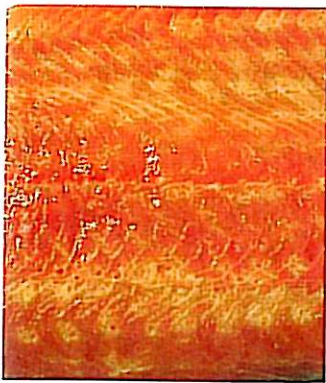
Røkt laksefilet med fargeavvik.

pågående prosjekter med ulik vinkling på PD-problematikken. En slik koordinering gir bedre utnyttelse av forsøksmateriale og -resultater, og derved raskere kunnskapsframgang, samt mer forskning for hver krone.